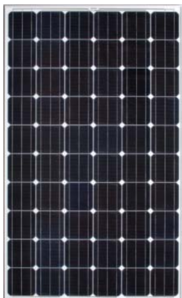
【サンテックパワー製】